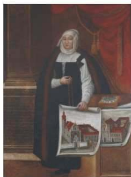
Batthyány Erzsébet grófnő (1619–1674) Élt 55 évet.

Batthyány II. Ferenc és Lobkovitz Poppel Éva leánya, Batthyány I. Ádám húga . 1638-ban férjhez ment Erdődy III. György támkomesterhez, az országgyűlés több rendbeli választmányi tagjához. 1663-ban megözvegyülvén nem gondolt az újbóli férjhezmenetelre. Batthyány Erzsébet vallásos buzgósága, jótékonykodása a domonkos rend támogatásában, ispotály alapításában, a szegényeknek tett adományokban nyilvánult meg. Az 1638-ban Szentmárton községben letelepített domonkos rend temploma igen rossz állapotban volt.