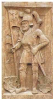
Batthyány I. Ferenc (1497 – 1566) vörösmárvány domborműve