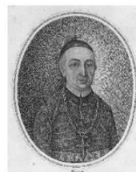
Német Újvári Gróf BATTHYÁNYI IGNÁCZ erdélyi Erdélyi Kisk. Püspök.

Batthyány Ignác gróf (Németújvár, 1741. jan. 30 – Kolozsvár, 1798. nov. 17.) Élt 57 évet. Batthyány Imre (1701 – 1774) és gróf Saurau (Sauer) Mária Anna (1720 – 1764) másodszülött fia. Batthyány I. Ádám ükunokája. Erdélyi megyéspüspök és titkos tanácsos, egyháztörténész, könyvgyűjtő, a gyulafehérvári Batthyáneum megalapítója.